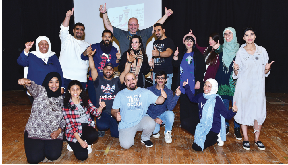
المشاركون في الورش التدريبية في لحظة جماعية